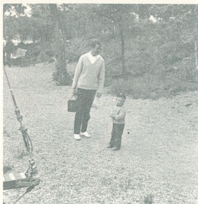
Två generationer Leva