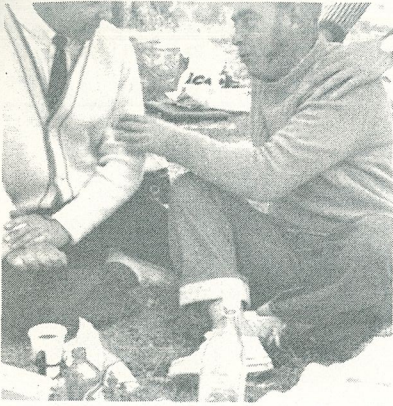
Hamnkaptener i samspråk.