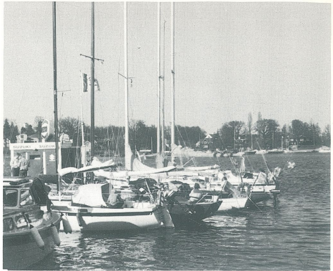
Hamnen i Stallarholmen