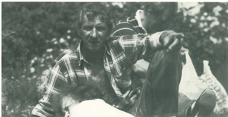
Farfar. Lika gammal.