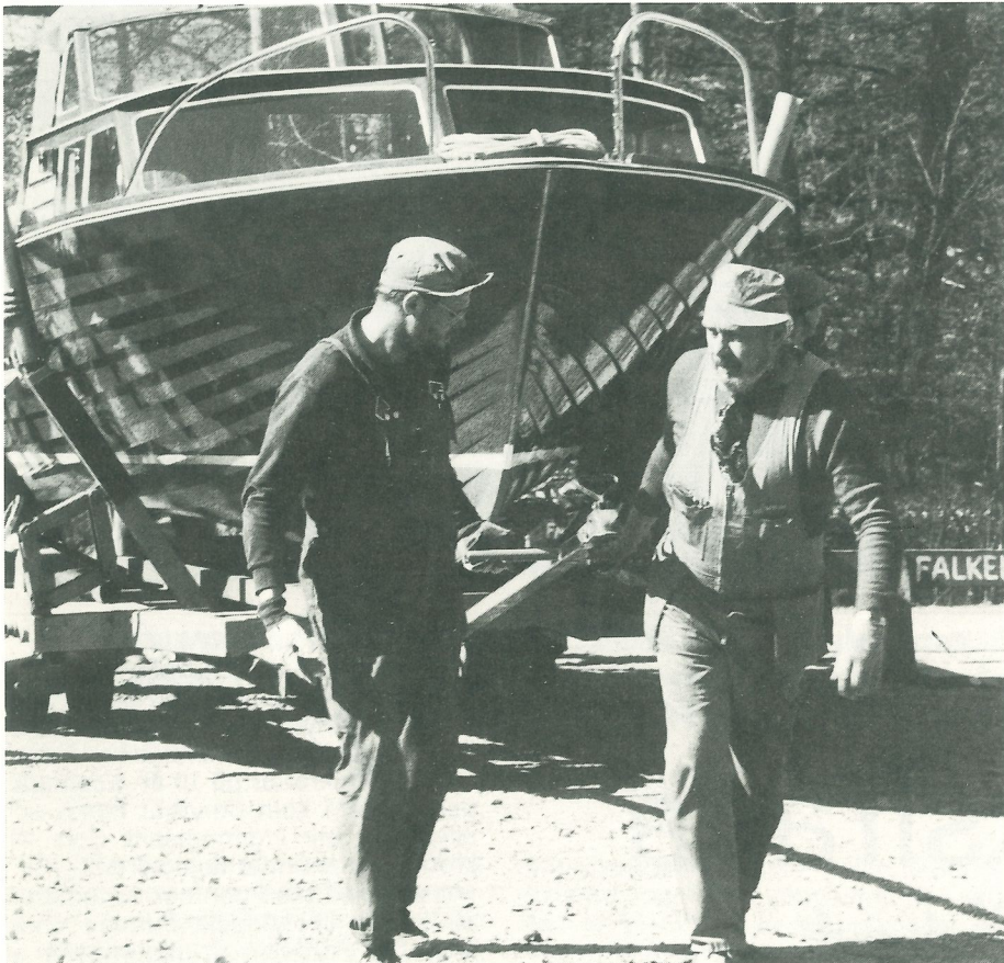
Undanplockning anbefalls så snart dagens båt gått i sjön.

– Kolla prylarna ordentligt i god tid före upptagningen, manar Janne. Och vad beträffar sjösättningen så gäller det att höra av sig i tid om man vill ha ändrad sjösättningsdag – senast två veckor före första sjösättningsdag.